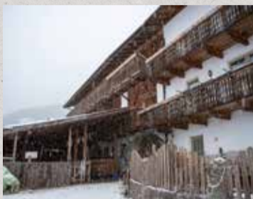
Il maso Grünberger