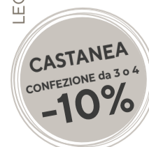
LEG RELIEF GEL