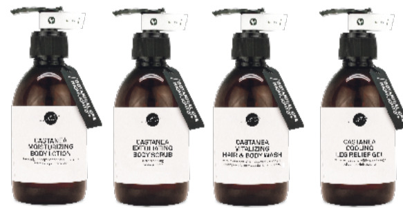
CASTANEA BODY LOTION

Il nostro concetto di benessere include anche i trattamenti Vitalpina come le passeggiate della respirazione, percorsi Kneipp, applicazioni balance e bagni alpini (solo in estate). Tutti i nostri trattamenti benessere e di bellezza sono disponibili online: www.unterwirt.com